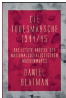
Standardwerk zu den Todesmärschen von Daniel Blatman

Unter den rund 800 Polizeihäftlingen des Marsches nach Kiel waren in der Mehrzahl ausländische Gefangene, von denen die Lebenswege des auf dem Marsch ermordeten Tschechen Josef Tichý und des gleichfalls umgebrachten Franzosen Maurice Sachs , der eine schillernde und zwiespältige Figur war, vorgestellt werden.