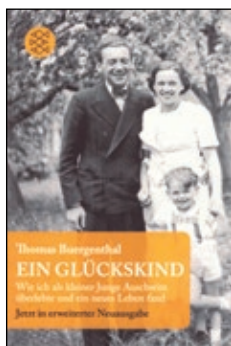
Erinnerungsbericht von Thomas Buergenthal, Überlebender des Todesmarsches vom KZ Auschwitz zum KZ Sachsenhausen im Januar 1945

Viele andere Menschen sind durch ähnliche Erfahrungen wie jene, die Thomas Buergenthal gemacht hat, gebrochen oder getötet worden. Wir wollen mit unserem Buch ein wenig zur Aufarbeitung dieser Zeit des Nationalsozialismus, der Konzentrationslager und der Todesmärsche beitragen. Und wir stellen uns heute die Frage, wie wir in unserer Welt die Menschenrechte, die auf diesen Todesmärschen mit Füßen getreten wurden, schützen können. Wir möchten, dass solche gravierenden