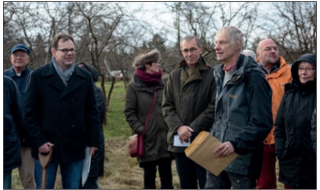
In Zusammenarbeit mit dem »Arbeitskreis alte Obstwiese Kieler Str. 515« wurden am 5.12.2015 Gedenkbäume für Teilnehmer*innen des Todesmarsches gepflanzt. Diese Wiese liegt direkt an der Wegstrecke des Marsches.