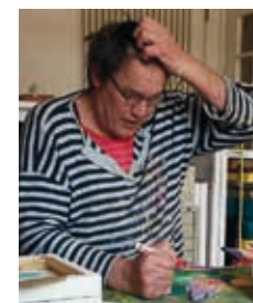
2016: MARX KOMMT IN KREFELD WIEDER