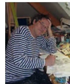
2012: NACHDENKEN ÜBER 30 JAHRE SPÄTER