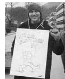
1976: IN DER KARL-MARX-STADT TRIER