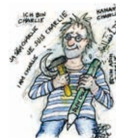
2015: VON ANSCHLÄGEN BETROFFEN

© VSA: VERLAG HAMBURG 2018, ST. GEORGS KIRCHHOF 6, 20099 HAMBURG © DER ZEICHNUNGEN: JARI BANAS 1980, 2012, 2016, 2018 ALLE RECHTE VORBEHALTEN DRUCK UND BUCHBINDEARBEITEN: CPI BOOKS GMBH, LECK ISBN 978-3-89965-798-2