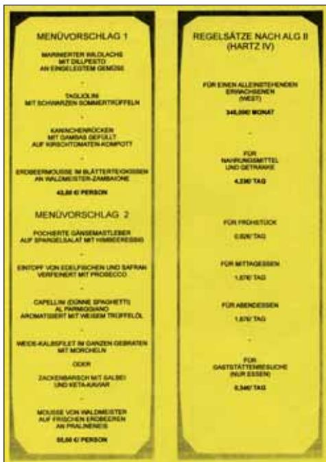
Eigene Menü- karte für die »Zitronerie«

die Überraschungsgäste wieder verschwunden und die gut situierten Restaurantbesucher haben ein neues Gesprächsthema für diesen Abend: Hartz IV.