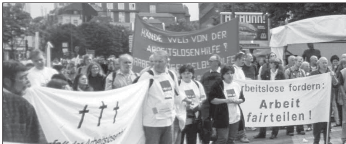
Erste ver.di- Erwerbslosen- demonstration 2002 in Köln