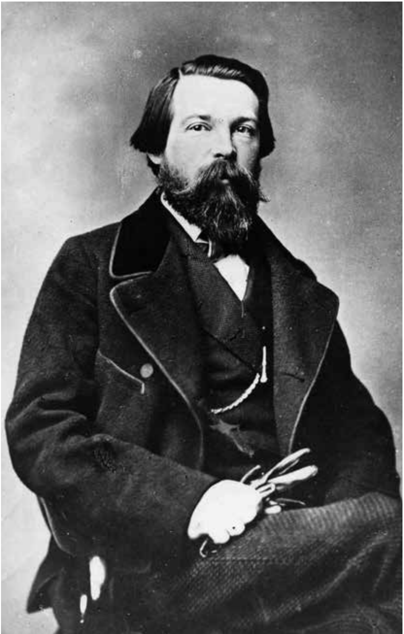
Friedrich Engels auf einer Fotografie um 1855