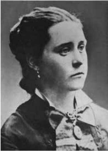
Mary Burns (1821-1863)