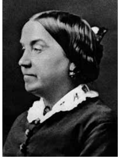
Lizzy Burns (1827-1878)

ten« auf, einer Organisation deutscher Handwerker in England. Auch kontaktierte er Führer der »Chartist Movement«, einer in den 1830er Jahren gegründeten politischen Reformbewegung, die für die Zulassung von Gewerkschaften, Arbeitszeitverkürzung (Zehn-Stunden-Tag), Erweiterung des Wahlrechts und Aufhebung der Kornzölle (d.h. Senkung der Kosten für den Lebensunterhalt) kämpfte.