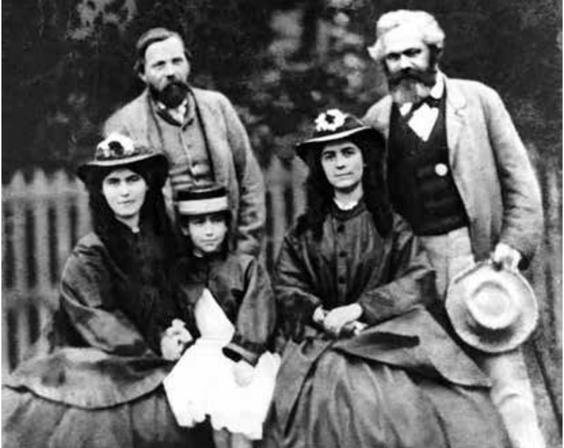
Friedrich Engels und Karl Marx mit seinen Töchtern Laura, Eleanor und Jenny (v.l.n.r.), Mai 1864

Jahr 1850, ein kleiner, aber feiner Versuch zur materialistischen Interpretation der zentraleuropäischen Bauernaufstände im 16. Jahrhundert. 20