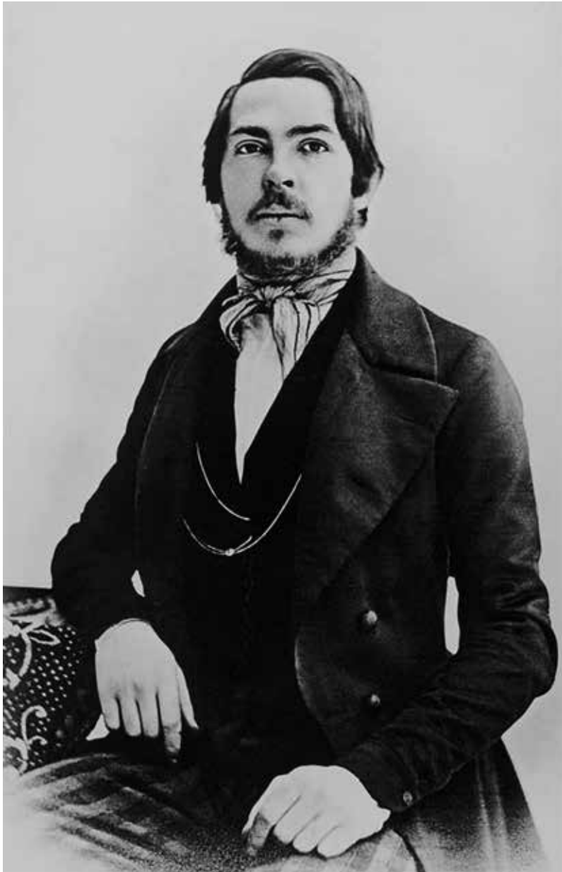
Friedrich Engels (Foto von 1845)